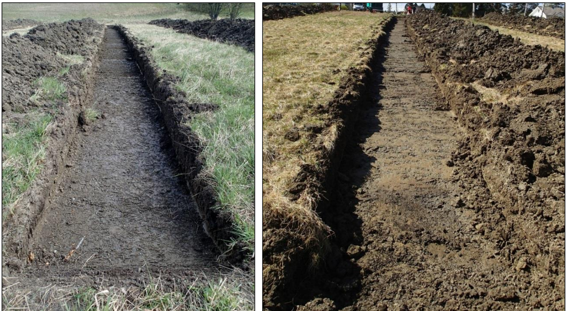
Vasen. Koeija 3 koilliseen. Oikea. Koeija 4 lounaaseen. Tutkittu alue kuvattuna pohjoiseen. Lähimpänä etualla on koeija 6