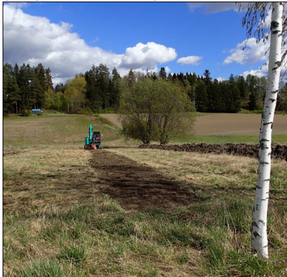
Koeojat täytettiin tutkimuksen jälkeen. Kuva itä-koilliseen.