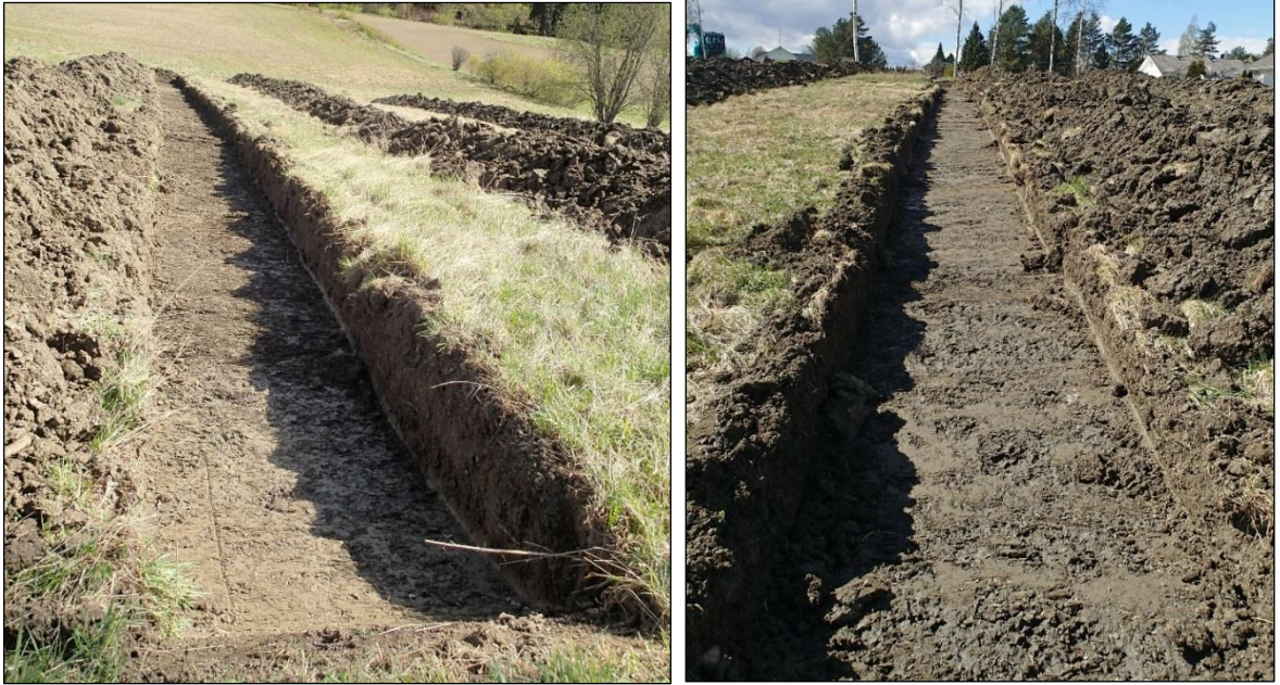
Vasen. Koeija 1 koilliseen. Oikea. Koeija 2 lounaaseen.