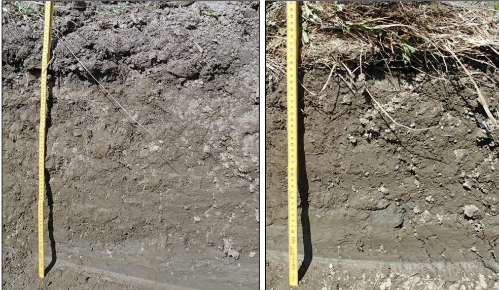
Vasemmalla koeojan 1 ja oikealla koeojan 2 seinämä. Ojissa todettiin ohut savinen, vähän multainen muokkauskerros, jonka alla tiivis puhdas savi.