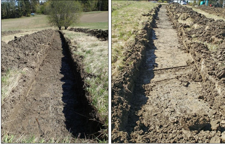
Vasen. Koeoja 5 koilliseen. Oikea. Koeoja 6 lounaaseen.