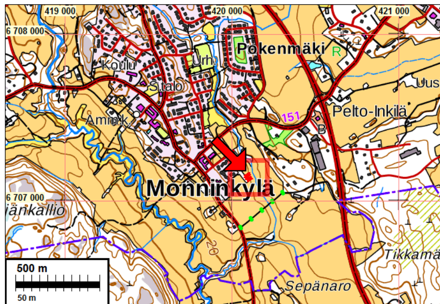
Tutkimusalueen sijainti on osoitettu punaisella nuolella.

Tulokset Rakennushankkeeseen liittyen Mikroliitti Oy teki Monninkylä Isokylä historiallisen ajan muinaisjäännöksen kaakkoisosassa, Kotipellontien itäpuolisella pellolla tarkkuusinventoinnin vuonna 2017. Tutkimuksessa ei tuolloin todettu mitään merkkejä kiinteästä muinaisjäännöksestä. Nyt tutkittu alue sijaitsee vuoden 2017 tutkimusalueen etelä- kaakkoispuolella. Tutkimusalueen laajuus oli n. 2300 m 2 . Alue on vanhaa peltoa. Tutkitulla alueella ei havaittu kiinteää muinaisjäännöstä tai muita vanhoja jäännöksiä.