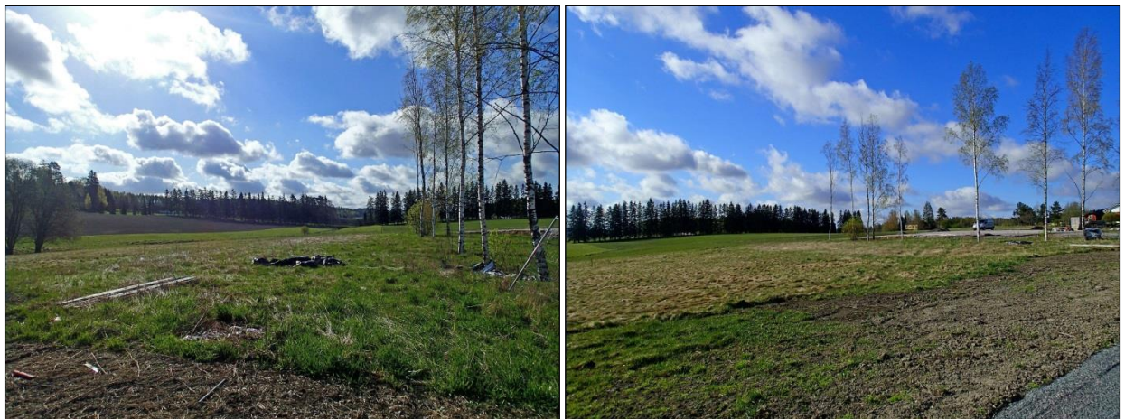
Alue ennen tutkimusta etelä-kaakkoon ja lounaaseen.